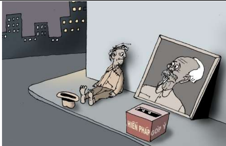
Góp ý sửa đổi Hiến pháp (Babui-DCVonline.net)

Xấu hổ, liêm sỉ là một trong những đức tính Ông Trời phú bẩm cho con người để xây dựng nhân cách, chùn tay trước điều xấu định làm, sửa chữa những lỗi lầm đã phạm và thay đổi lối ứng xử, cách hành động của mình, đặc biệt đối với tha nhân và xã hội trong tương lai. Nhưng lịch sử mấy mươi năm của đảng CS cho thấy đức tính này hầu như vắng bóng hoàn toàn nơi các đảng viên, nhất là nơi hàng lãnh đạo đảng. Thảo nào chính trị ngày càng hà khắc, kinh tế ngày càng suy thoái, đạo đức ngày càng lụn bại, xã hội ngày càng hỗn loạn và đất nước ngày càng lâm nguy! BBT